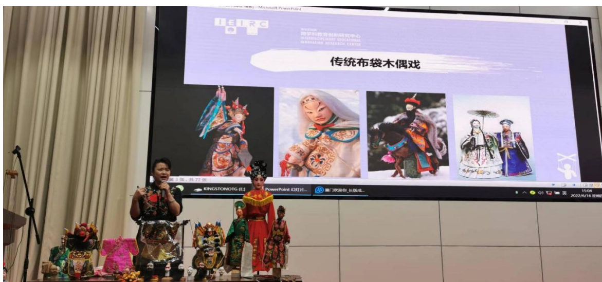
图 4：闽南非遗进校园系列活动现场（四）

视频，大家还进一步了解了非遗项目及其传承人的故事，感受中华优秀传统文化的心灵滋养。活动期间还开展了“互动体验”活态展示和“集思广益”沙龙交流等活动。通过沉浸式体验活动，邀请非遗传承人进行现场展示，还原非遗项目，并互动教学。