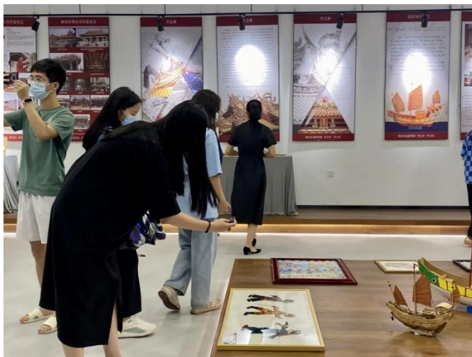
图 2：闽南非遗进校园系列活动现场（一）

本次系列活动基于 2022 年度厦门市文艺发展专项资金闽南文化进校园资助项目——《闽南非遗进校园，知行合一传文化》和厦门理工学院“主动服务厦门发展年”行动计划