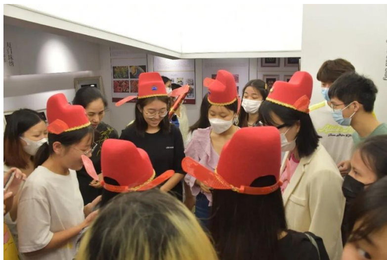
图 3：闽南非遗进校园系列活动现场（二）

本次系列活动基于 2022 年度厦门市文艺发展专项资金闽南文化进校园资助项目——《闽南非遗进校园，知行合一传文化》和厦门理工学院“主动服务厦门发展年”行动计划