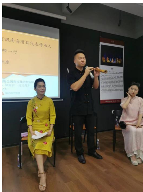
图 4：闽南非遗进校园系列活动现场（三）

深入开展。邀请了南音、福建布袋木偶戏（厦门）、闽南皮影戏、厦门漆线雕技艺、厦门珠绣、惠安石雕（影雕）、闽南传统民居营造技艺、剪瓷雕、锡雕（同安锡雕）、厦门微雕（许通海微雕制作技艺）、珠光青瓷烧制技艺（同安汀溪）、福船制作技艺（王船）、中秋节（中秋博饼）、春仔花习俗、闽台风狮爷信仰等近 20 项闽南非遗项目走进校园。